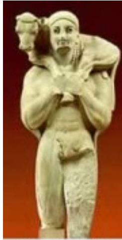
Athens 570 BC