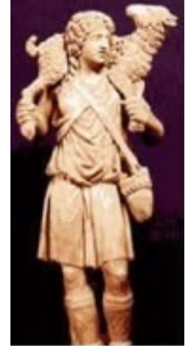
Jesus 4th century AD